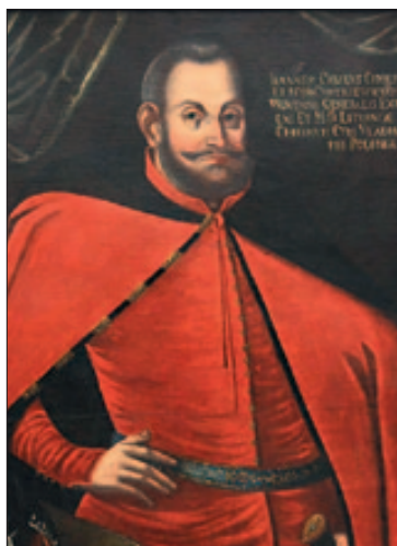
Jan Karol Chodkiewicz, hetman wielki litewski

Zajmujący dogodną pozycję Szwedzi nie śpieszyli się z rozpoczęciem bitwy. Chcąc skłonić przeciwnika do ruchu, hetman Chodkiewicz wysłał harcowników i nakazał części oddziałów pozorowany odwrót. Podstęp skłonił Karola IX do ścigania wymykającego się, słabszego przeciwnika. Gdy szwedzka piechota minęła dno doliny i zaczęła wspinać się na wzgórze zajmowane przez Polaków, została ostrzelana przez artylerię i polską piechotę. Z powstałego zamieszania skorzystała husaria. Na piesze bataliony uderzyły