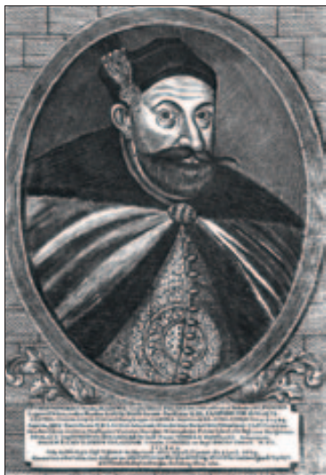
Krzysztof Radziwiłł „Piorun”, hetman wielki litewski

syna króla szwedzkiego Jana i Katarzyny Jagiellonki, córki Zygmunta I Starego. Koronacja, która odbyła się w 1587 r., budziła wielkie nadzieje. Perspektywa unii personalnej ze Szwecją, obietnica przyłączenia Estonii i żywa krew Jagiellonów czyniły z Zygmunta króla, który mógł ugruntować dominującą pozycję Rzeczypospolitej Obojga Narodów w tej części Europy.