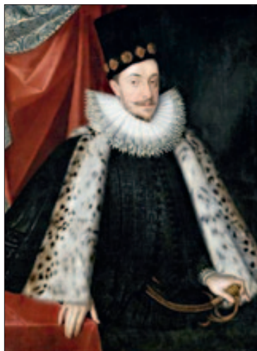
Zygmunt III Waza, Marcin Kober, ok. 1590 r.

Bezkrólewie po śmierci Stefana Batorego zakończyło się zwycięstwem stronnictwa popierającego kandydaturę królewicza szwedzkiego Zygmunta,