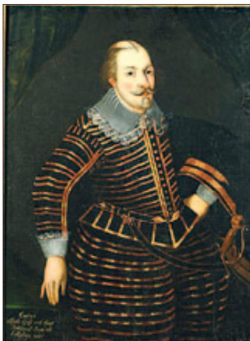
Karol IX Sudermański, król szwedzki