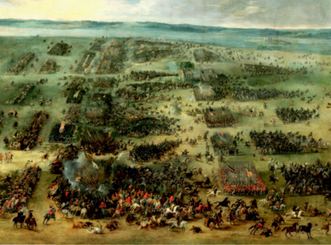
Bitwa pod Kircholmem, Pieter Snayers, 1630 r.