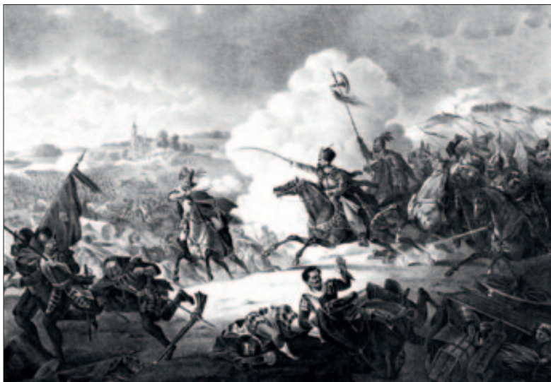
Jan Karol Chodkiewicz w bitwie pod Kirchholmem

Plan hetmana Zamoyskiego, aby w jednej walnej bitwie rozbić armię szwedzką, nie został zrealizowany i rozpoczęła się długa wojna o zmiennym szczęściu. Szansę na korzystny dla Polski pokój zniwelował opór króla Zygmunta, który odrzucał zasadniczy warunek Szwedów – rezygnację króla i jego potomków z praw do szwedzkiej korony. W 1604 r. Karol Sudermański został koronowany na króla Szwecji. Losów wojny nie odmieniło świetne zwycięstwo liczących 2000 ludzi wojsk litewskich pod hetmanem Chodkiewiczem nad kolejnym, siedmiotysięcznym korpusem szwedzkim, oblegającym Biały Kamień. Sytuacja stawała się niekorzystna dla Polski, ponieważ Szwecja mobilizująca zasoby do wojny z Rzeczpospolitą wystawiała kolejne oddziały, podczas gdy nieopłacone i niezbyt liczne wojsko Chodkiewicza topniało z dnia na dzień. Skłócony sejm w 1605 r. nie uchwalił podatków na nowe zaciągi. Jan Karol Chodkiewicz, teraz już hetman wielki litewski, z własnych środków opłacił część zaległego żołdu, zapobiegając buntowi żołnierzy. Skoncentrowana armia szwedzka, dowodzona przez samego Karola IX Sudermańskiego, ruszyła na Rygę. Odsiecz Chodkiewicza dotarła pod Kirchholm, leżący ok. 15 km od Rygi, w czwartym dniu oblężenia.